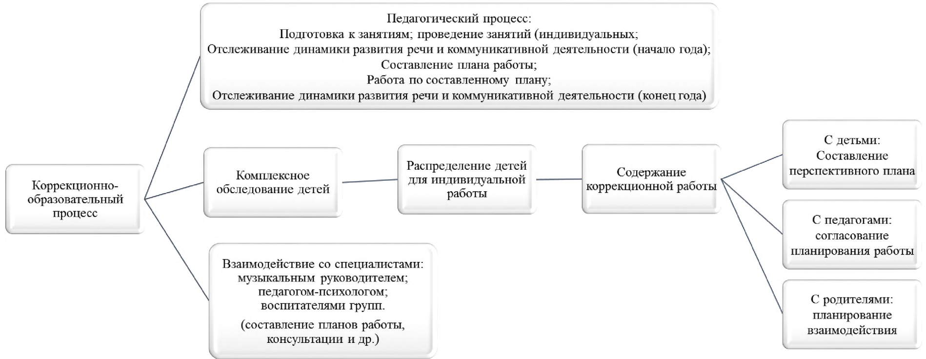
Схема организации работы учителя-логопеда